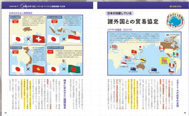
コラム 諸外国との貿易協定