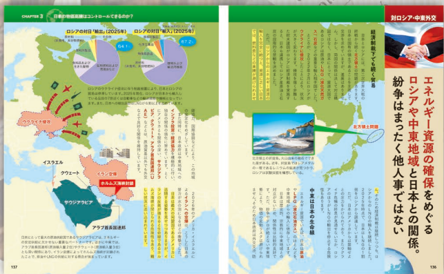
Chapter3 日本の物価高騰はコントロールできるのか?

ファイナンシャルプランナー(CFP)、早稲田大学エクステンションセンター講師。1963年、岐阜県出身。「公平・中立・客観的」「数字による見える化」「数字をカミクダク」をモットーに資産運用・投資・金融・経済教育に力を注いでいる。セミナー・講演回数は年間370回を超える。