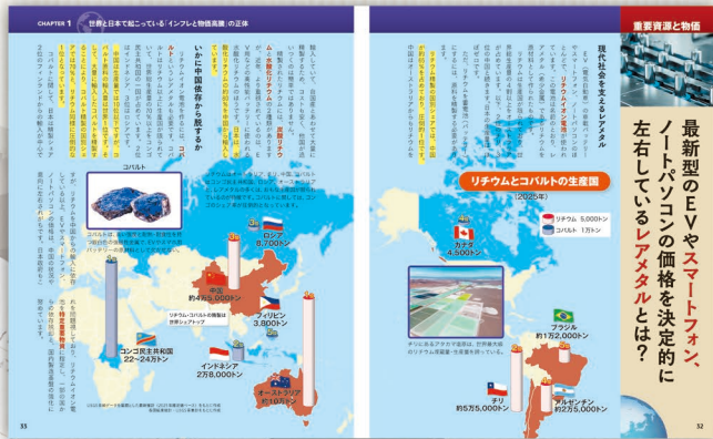
Chapter1 世界と日本で起こっている「インフレと物価高騰」の正体