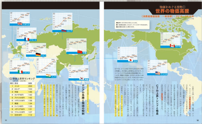
物価をめぐる情勢① 世界の物価高騰

身近なコメの価格から円安の仕組みまで、物価高騰の疑問をやさしく解説！ 主婦層からビジネス層まで幅広い読者におすすめの二冊です。