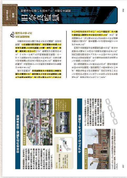
【旧奈良監獄】 第2章 人はどうやって人を閉じ込めたのか