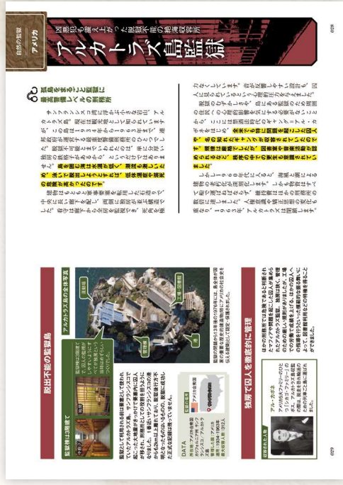
【アルカトラズ監獄】 第1章 環境が監獄をつくり出す